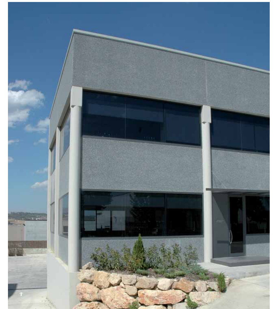
Acabado Piedra Gris para Panel y Peto