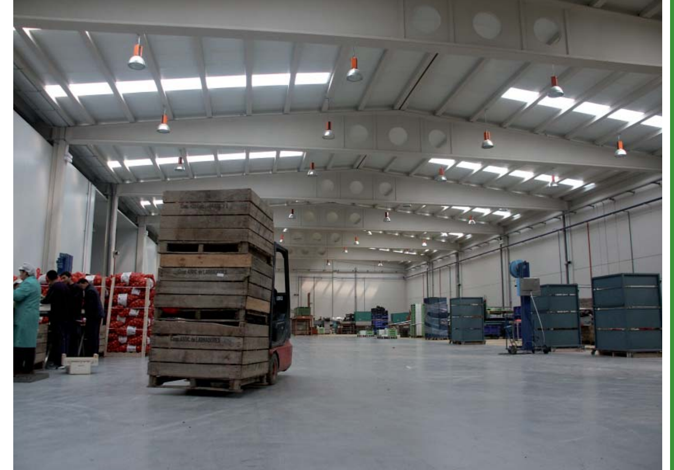
Kooperatibei Agrícola de Tudela. (Navarra)