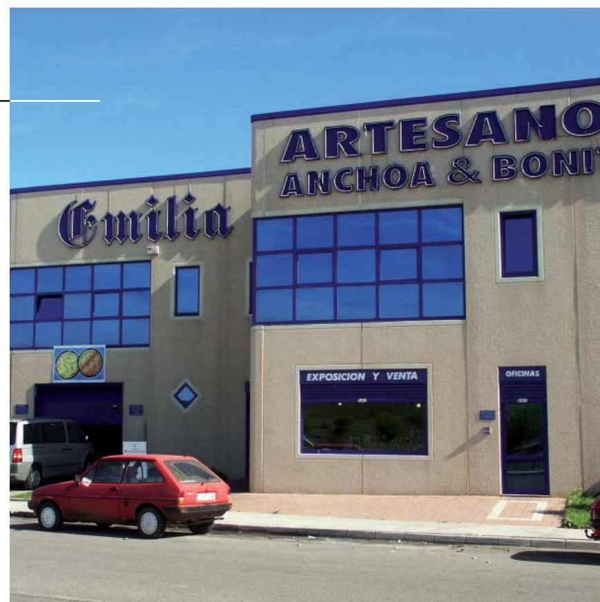
Kontserbagileei Santoña. Santoña (Cantabria)