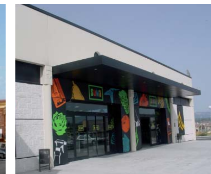
Supermerkatuei Suma. Mora de Ebro (Tarragona)