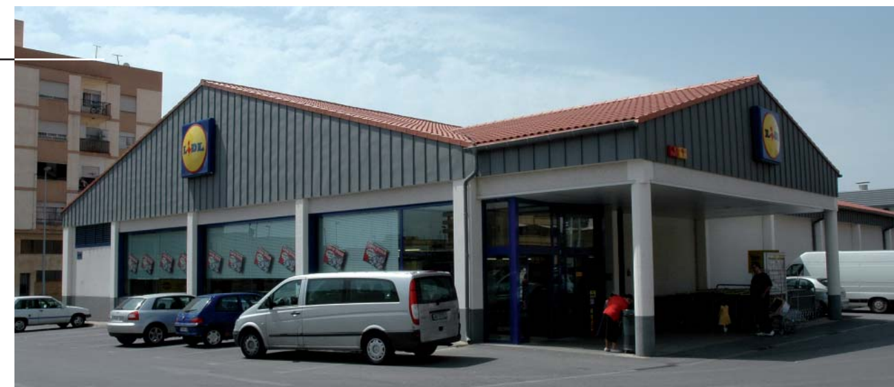
Supermerkatuei Lidl. Castellón de La Plana (Castellón)