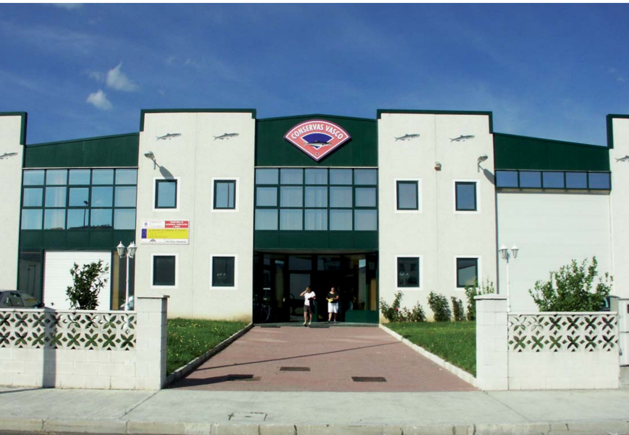
Kontserbagileei Laredo. Laredo (Cantabria)