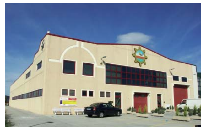
Precocinados Benetán. Errentería (Guipuzcoa)

Merkatuko porositate-indizerik txikieneko itxitura-panela, higiene-eta osasun-helburuetarako barne-akabera egokikoa.