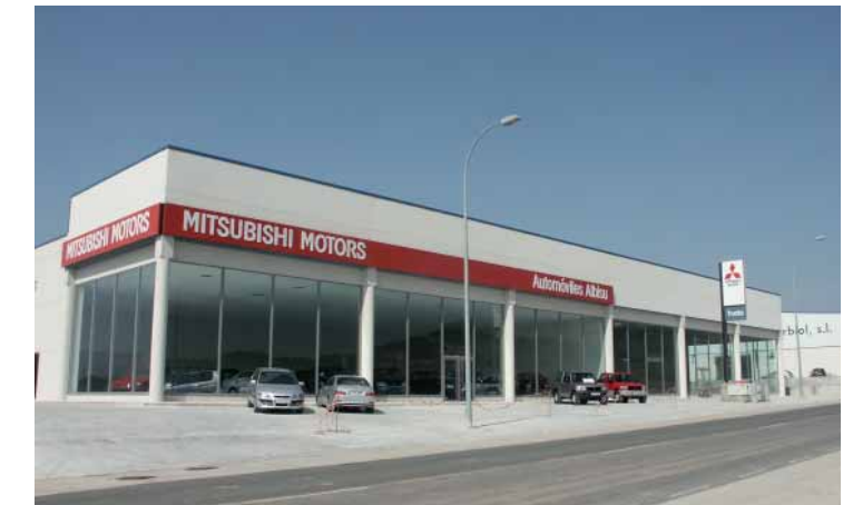
Concesionario y Taller Mitsubishi Motors. Tudela (Navarra)