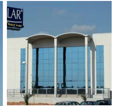
Somilar. Carlet (Valencia)