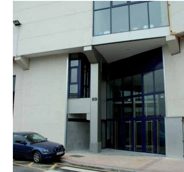
Rotativa Heraldo de Aragón. Villanueva de Gállego (Zaragoza)